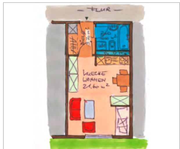
Grundriß nicht maßstäblich !

Das Bad mit Badewanne, Toilette und Waschbecken ist raumhoch gefliest. In der Küchenzeile ist ein Fliesenspiegel vorhanden.